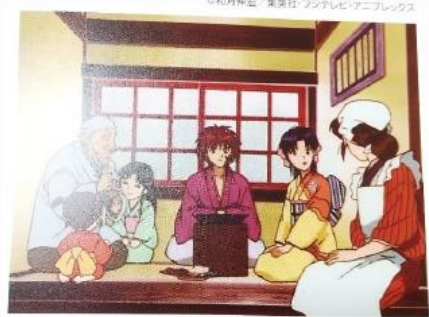
▲剣心がお昼ごはんをごちそうすることになり、筆のいる道場 に出入りする仲間と牛鍋屋へ。剣心たちは、鍋をかこみ、楽 しい時間を過ごす。