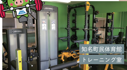
知名町民体育館 トレーニング室