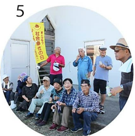
1_現在の稲水公園。2_マチヘソミーティングは、いろんな立場の方と一緒に組織横断型で実施しています。3_メントマリ公園をもっと上手に使いたい。4_知名字敬老会。5_宝友会の清掃作業は朝6時半から。早いっ!!