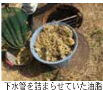
下水管を詰まらせていた油脂