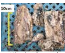
下水管の中で凝固した油脂