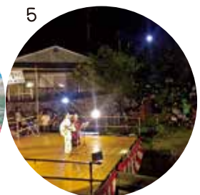
1_友達がえらぶ産の夜光貝で「えらぶピアス」を作ってくれました。2_お気に入りのビーチで下手くそな三味線を練習中です。3_初めて食べた島の魚。まさかこの熱帯魚を食べる日がくるなんて...。4_舟こぎで奄美大島に行ってきました。5_瀬利覚のホーまつり、素敵でした。