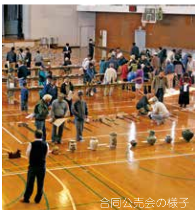
合同公売会の様子