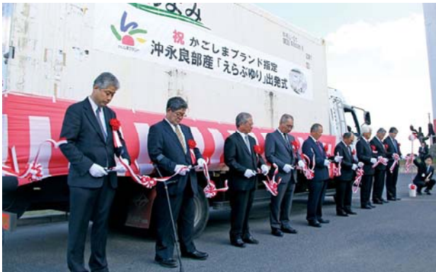
問 農林課 (84)3164