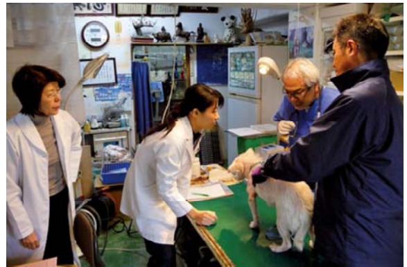
問 保健福祉課 (84)3153

予約制となりますので、診療を希望される際は、奄美動物病院(電話 0997(52)2022)へご連絡ください。