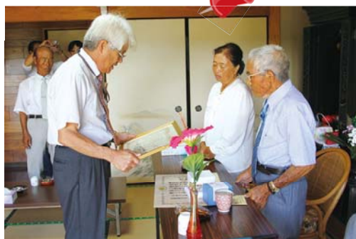
長寿を祝う表敬訪問

琉球王府時代、斎場御嶽で行われた聞得大君の就任式をモチーフにした創作歌舞劇「聞得大君御新下り」が、9月1日、あしびの郷・ちなでありました。奄美群島日本復帰60周年記念プレゼント公演としておこなわれたもので、劇の前には、ヤッコ踊り4団体による競演もありました。