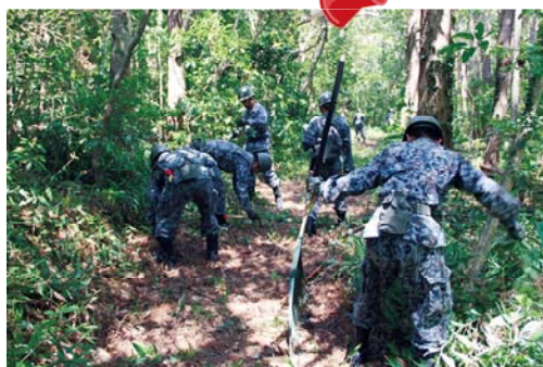
大山遊歩道清掃作業

大山の遊歩道の清掃作業が、9月2日にありました。作業は、航空自衛隊第55警戒隊隊員の協力のもと行われ、遊歩道に横たわった松の木などをチェーンソーで切断したり、草刈機で除草作業をしたり、3時間ほどかけて人が歩けるほどにきれいに清掃されました。