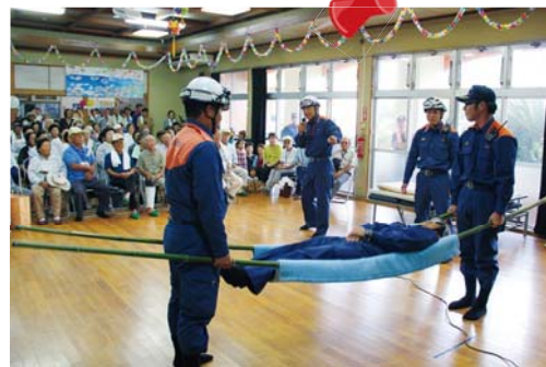
防災体制の確立を図るため

社会人野球秋期リーグ戦(野球連盟主催)の決勝戦が、9月13日、大山総合グラウンドであり、自衛隊を4対1で下したピロンズXが、春、秋連覇を達成しました。3回に1点を先制されたピロンズXは、その裏に一挙4点の猛攻をみせ、そのまま逃げ切り優勝を果たしました。