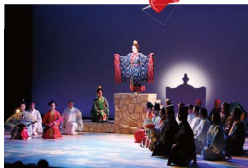
沖縄人の心の豊かさを伝統の芸が語る

大山の遊歩道の清掃作業が、9月2日にありました。作業は、航空自衛隊第55警戒隊隊員の協力のもと行われ、遊歩道に横たわった松の木などをチェーンソーで切断したり、草刈機で除草作業をしたり、3時間ほどかけて人が歩けるほどにきれいに清掃されました。