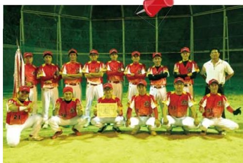
ピロンズXが春、秋連覇

沖永良部ダイビング協会による「珊瑚の再生・植え付けプロジェクト2013」が、9月7日にありました。この先もずっと健康な珊瑚がある海を残すことを目的に初めて行われたもので、活動を継続して行くために、今後珊瑚の株主を募集していくとのことです。