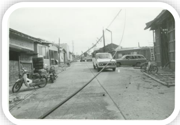
沖永良部台風後のまちの様子