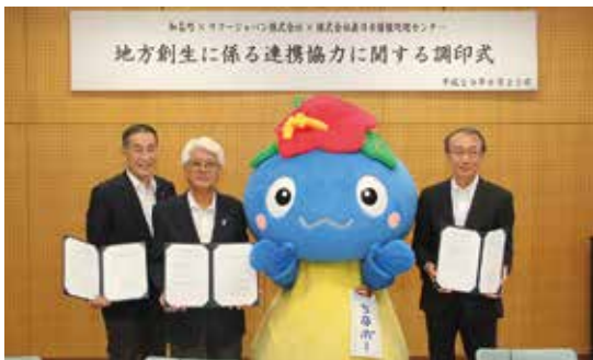
地域活性化のために 民間企業と連携協定

知名町消防団による水難救助訓練が、8月27日に住吉港でありました。今回の訓練には各分団からの代表者が参加。海上で事故が起きた場合を想定して、水中や水上における救助方法などを訓練しました。参加した消防団員は、あらゆる事故に迅速に対応できるように真剣に訓練に臨んでいました。