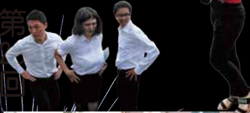
パレードでも 24時間走るわよ