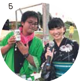
1_スクールキャンプを運営してくれた中学生達 2_昔はどんな遊びをしていたのかな? 3_みんなに見守られながら包丁に挑戦! 4_シードリーム東さんによるお話しでは浜の砂にたくさんのゴミが混じっていることがわかる実験も。5_岬祭りと盆踊りで司会を担当しました!