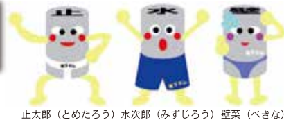
止太郎 (とめたろう) 水次郎 (みずじろう) 壁菜 (べきな)