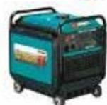
発電力に余裕のある大型発電機