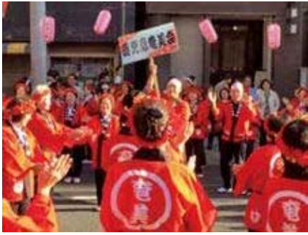
輪になって踊る鹿児島奄美会のメンバー

鹿児島市政60周年を記念して昭和24年に始まり、おはら祭りは、今では南九州最大の祭りとして定着しています。今年も11月2、3日にかけて開催され、私も鹿児島奄美会の一員として、総踊りに参加してきました。祭りでは様々な催し物が行われますが、なんといつでもメインは「総踊り」です。総勢2万人を越える踊り手が、それぞれのグループごとに揃えた法被や衣装に身をつつみ、おはら節や鹿児島はんや節などの曲にあわ