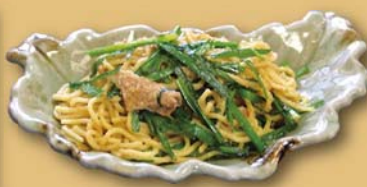
ごま風味 塩焼きそば