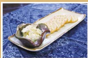
自家製 フレッシュチーズ(夜のみ)