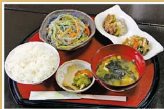
島内産の野菜を中心とした人気の日替わりランチ。

ランチについてくる小鉢。左上から時計回りに、オクラの昆布和え、ジャコとピーマンの胡麻酢和え、赤瓜のシーチキン和え。