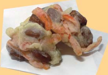
ピーナッツ入りかき揚げ