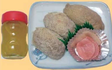
シークリブの果汁入り いなり寿司