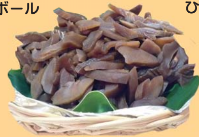
マンゴーの漬けもの