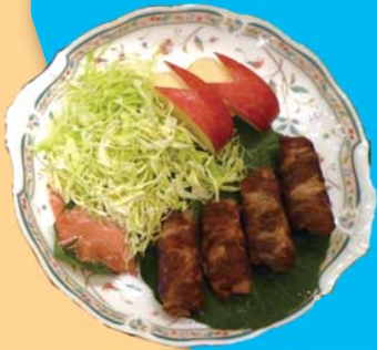
じゃが芋の肉まき