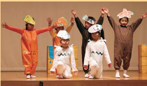
上城幼稚園児は野菜のかぶり物をして 「オペレッタ」を演じました