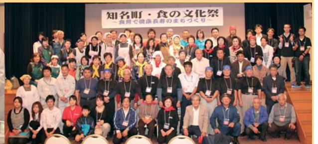
関係者全員での記念撮影