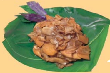
かぶのしょうゆ漬け