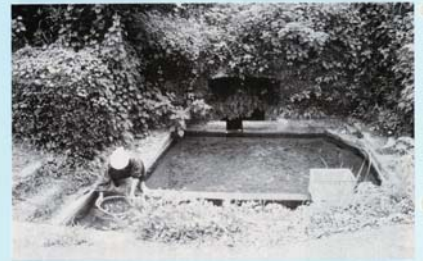
アタヌホー (平 津)

平津集落の中央部にある、アタヌホーは野菜を洗ったり洗濯をしたりするに現在でも利用されています。また、ヤマタローガニやシノボリ(イブ)、川えび(タナガ)なども生息しています。