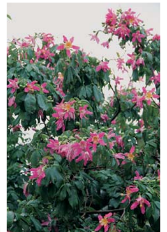
トックリキワタ (12/8 正名・福忠志さん宅)