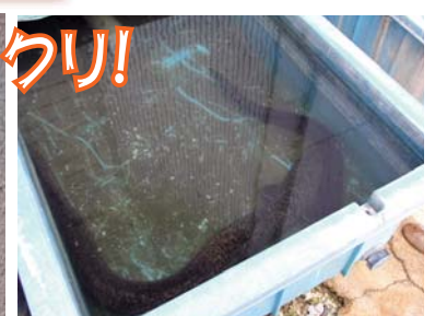
瀬利覚字の側溝で捕獲された大うなぎ (12/20 瀬利覚・草部隆徳さん宅)