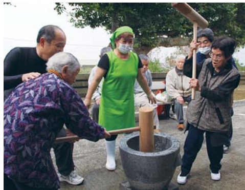
養護老人ホーム長寿園餅つき (12/15)