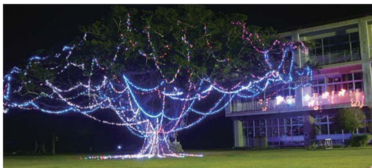
住吉小学校のガジュマルに取り付けられたイルミネーション (12/20)