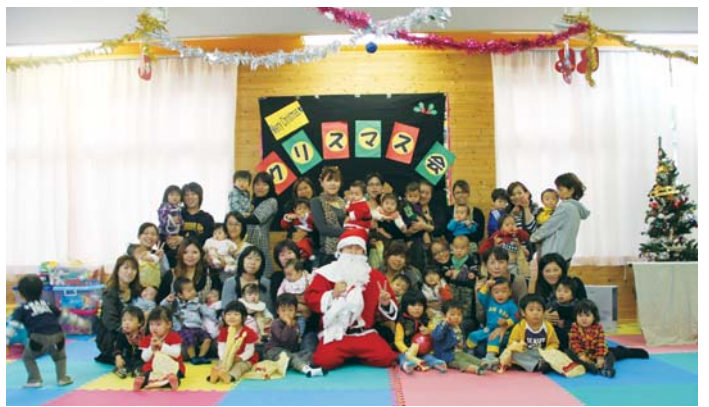
子育て広場クリスマス会 (12/20 保健センター)