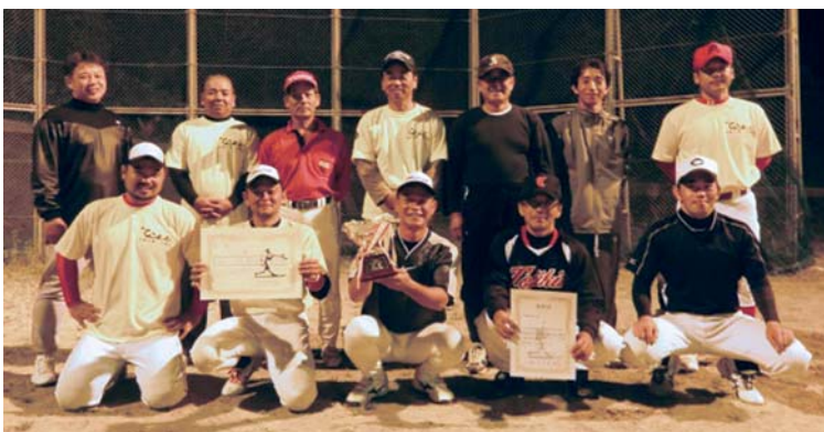
第9回地区対抗野球大会で、上平川が知名に逆転サヨナラ勝ちで初優勝しました。(10/27 大山総合グラウンド)