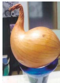
鳥?のようなたまねぎ