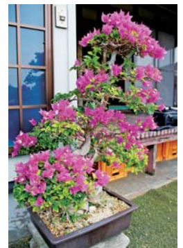
ブーゲンビリア (11/8 田皆 田邊正裕さん宅)