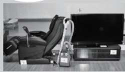
テレビ(テレビ台)、掃除機、マッサージチェア