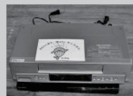
DVDプレーヤー、ビデオデッキ