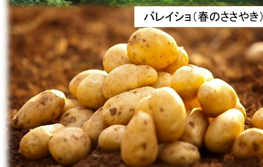
パレイショ(春のささやき)