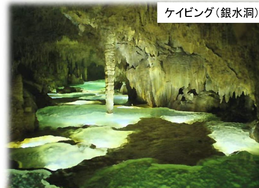
ケイピング(銀水洞)